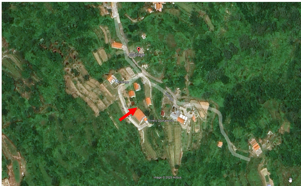
Slika 2. Lokacija objekta sa užom okolinom

Lokacija se nalaze na blago strmom terenu na kojoj se nalazi objekat u okviru koge se nalazi prostor za potrebe smještaja opreme za preradu grožđa u vino (slika 2.).