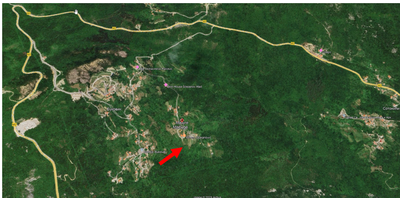
Slika 1. Geografski položaj lokacije objekta

Geografski položaj lokacije objekta dat je na slici 1., dok je na slici 2. prikazana lokacija objekta sa užom okolinom.