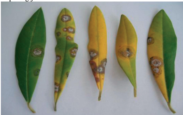
Slika 8. Simptomi napada gljive “Paunovo oko”

Rak masline ( Pseudomonas syringae pv. savastanoi (E.F. Smith) Stevens) - Ovo opasno oboljenje uzrokuje bakterija koja je poznata već od antičkog doba i javlja se u svim područjima uzgoja masline. Poznato je da ova bakterija parazitira i na oleandru. Mjere zaštite su skupe, kompleksne i nikada konačne. Niske temperature mogu oštetiti deblo odvajajući koru od debla, uslijed čega nastaju pukotine koje predstavljaju ulazno mjesto za ovu bakteriju. Razvoju bolesti pogoduju umjerena temperatura i povećana vlažnost. Napada sve dijelove biljke. Učestalije su štete na granama i grančicama stvarajući rakaste tvorevine koje vremenom hipertrofiraju do veličine od nekoliko centimetara stvarajući površinske pukotine. Isti simptomi mogu se uočiti i na lišću.