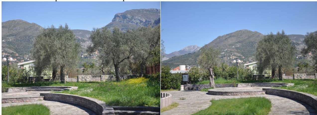
Slika 5. Uređeni prostor u okviru kompleksa “Stara maslina”

U okviru ulaza trebalo je obezbijediti prostor za čuvara, prodaju ulaznica i prodaju suvenira.