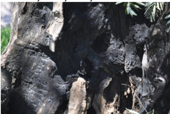
Slika 6. Posljedice djelovanja vatre na deblo masline

Drevno drvo se mučilo, ali je preživjelo. Jedino je izgoreni dio stabla ostao poluživ, nekako zakačen za ostatak debla. Tako je izdržao gotovo 50 godina, pa se početkom septembra 2004. godine gotovo trećina stabla odlomila i pala. 6