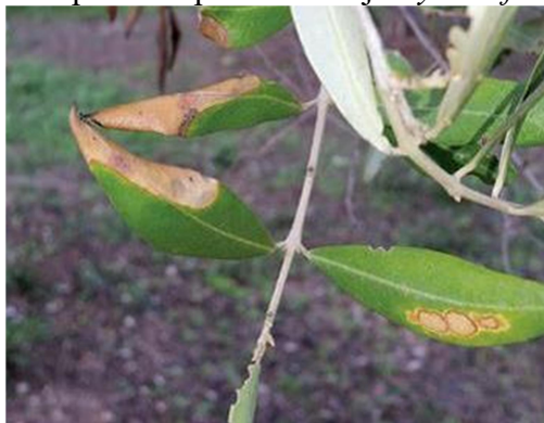
Slika 7. Simptomi napada bakterije Xylella fastidiosa 7

Na osnovu makroskopskih i mikroskopskih ispitivanja nije utvrđeno prisustvo gljiva prouzrokovala uvenuća poput Verticilium dahliae i Fusarium spp. PCR ITS je amplifikovao fragment oko 500 bp što ukazuje na prisustvo saprofitnih mikroorganizama. Tako da u analiziranom biljnom materijalu nije utvrđeno prisustvo značajnih fitopatogenih gljiva prouzrokovala uvenuća. Pretpostavka je da je na stablu, kao posledica dugotrajne izloženosti vlažnoj sredini, došlo do razvoja saprofitnih mikroorganizama koji nisu uzročnik uvenuća stabla, već da su uočene promjene posledica stanja kojem je ono bilo izloženo (višku vlage u zemljištu).