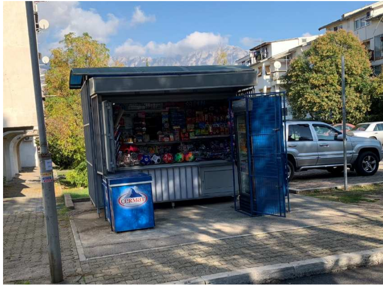
Površina 6 m 2