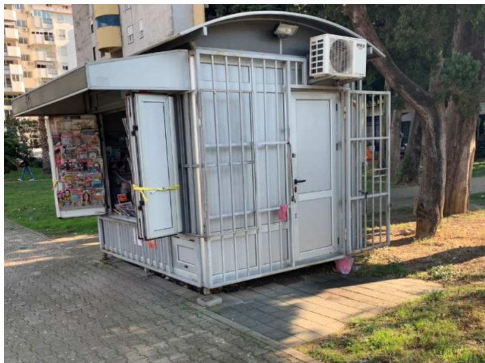
Površina 9 m 2